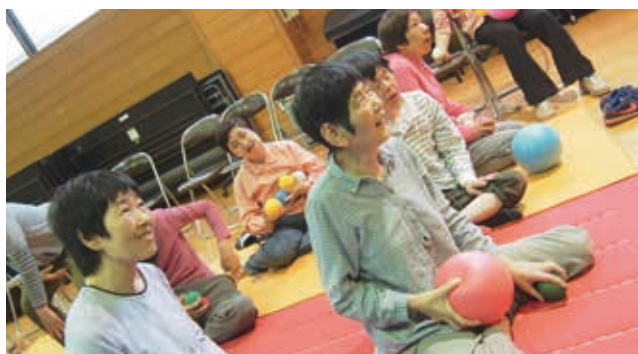
シンシン共に健やかに。心と身体の可動域無限大