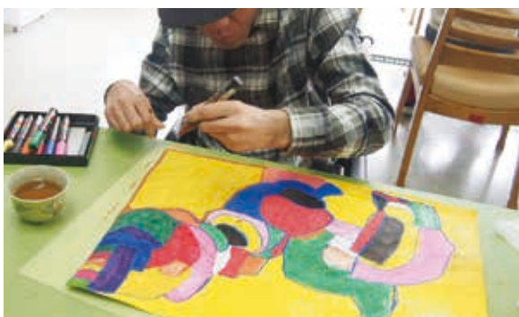
なごやかな趣味と創造の時間